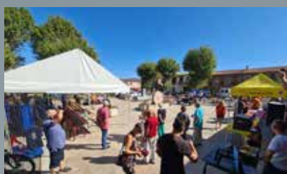
Premier forum des associations et nouveau arrivants

La finalisation du site est prévue sur le premier semestre 2021.