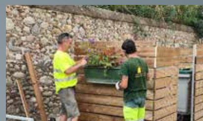
Amélioration et embellissement des collecteurs d'ordures ménagères.

Une occasion de réunir tous ceux qui font vivre le village en donnant de leur temps et en créant un dynamisme dans une volonté de rassembler.