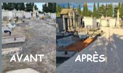
Travaux au cimetière, réfection et embellissement des allées

Les travaux de rénovation du cimetière sont pratiquement terminés.